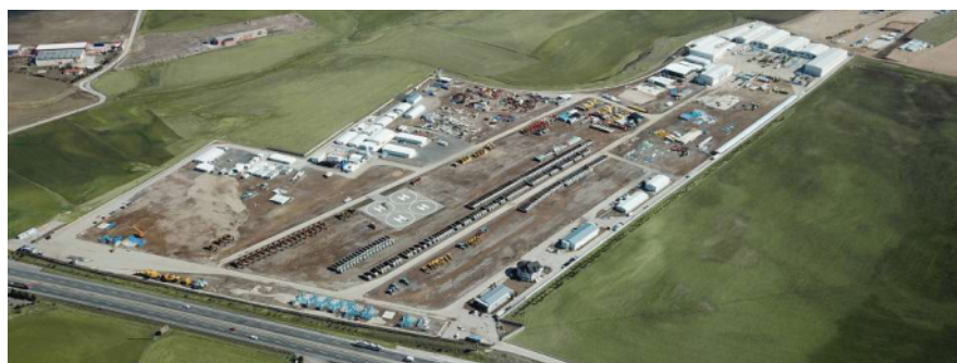
Oğulbey / Ankara / TURCIA