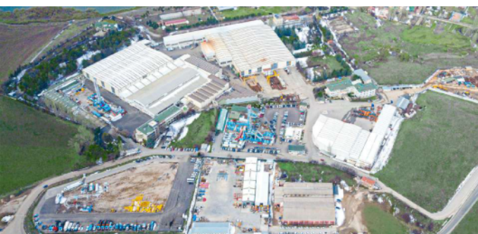
Gölbaşı / Ankara / TURCIA